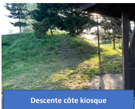
Descente côte kiosque