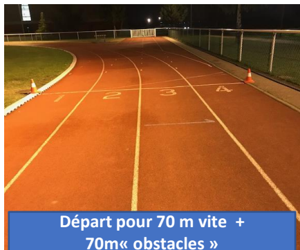
Départ pour 70 m vite + 70m« obstacles »