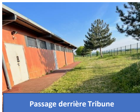
Passage derrière Tribune