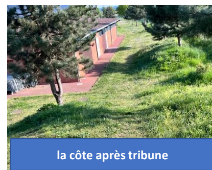
la côte après tribune