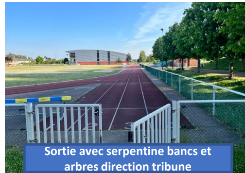
Sortie avec serpentine bancs et arbres direction tribune