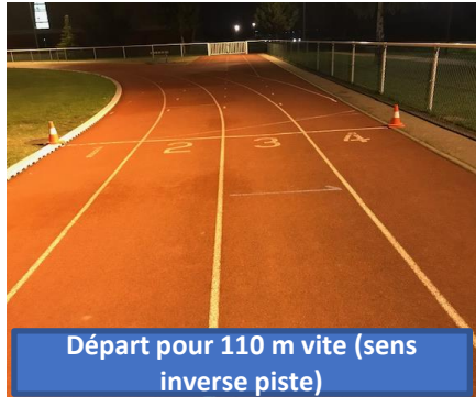
Départ pour 110 m vite (sens inverse piste)