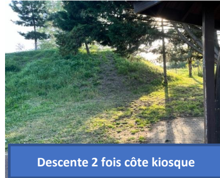
Descente 2 fois côte kiosque