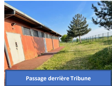
Passage derrière Tribune