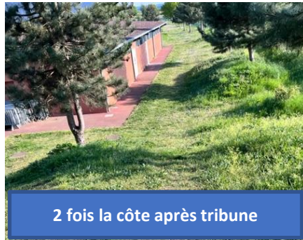
2 fois la côte après tribune