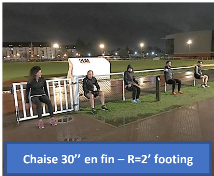
Chaise 30'' en fin – R=2' footing