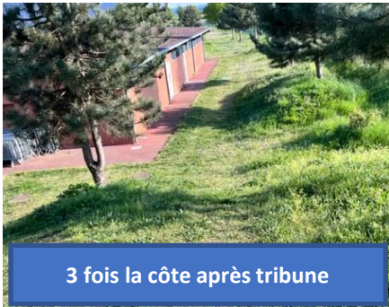
3 fois la côte après tribune