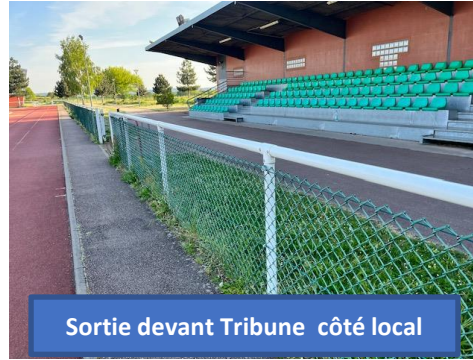
Sortie devant Tribune côté local