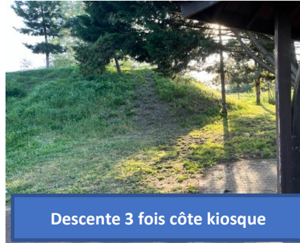
Descente 3 fois côte kiosque