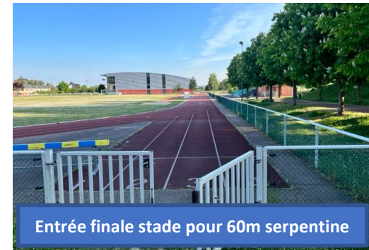
Entrée finale stade pour 60m serpentine