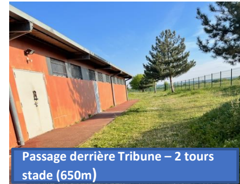
Passage derrière Tribune – 2 tours stade (650m)